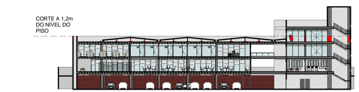
2 MOCK-UP 2º PAVIMENTO ESCALA 1 : 500