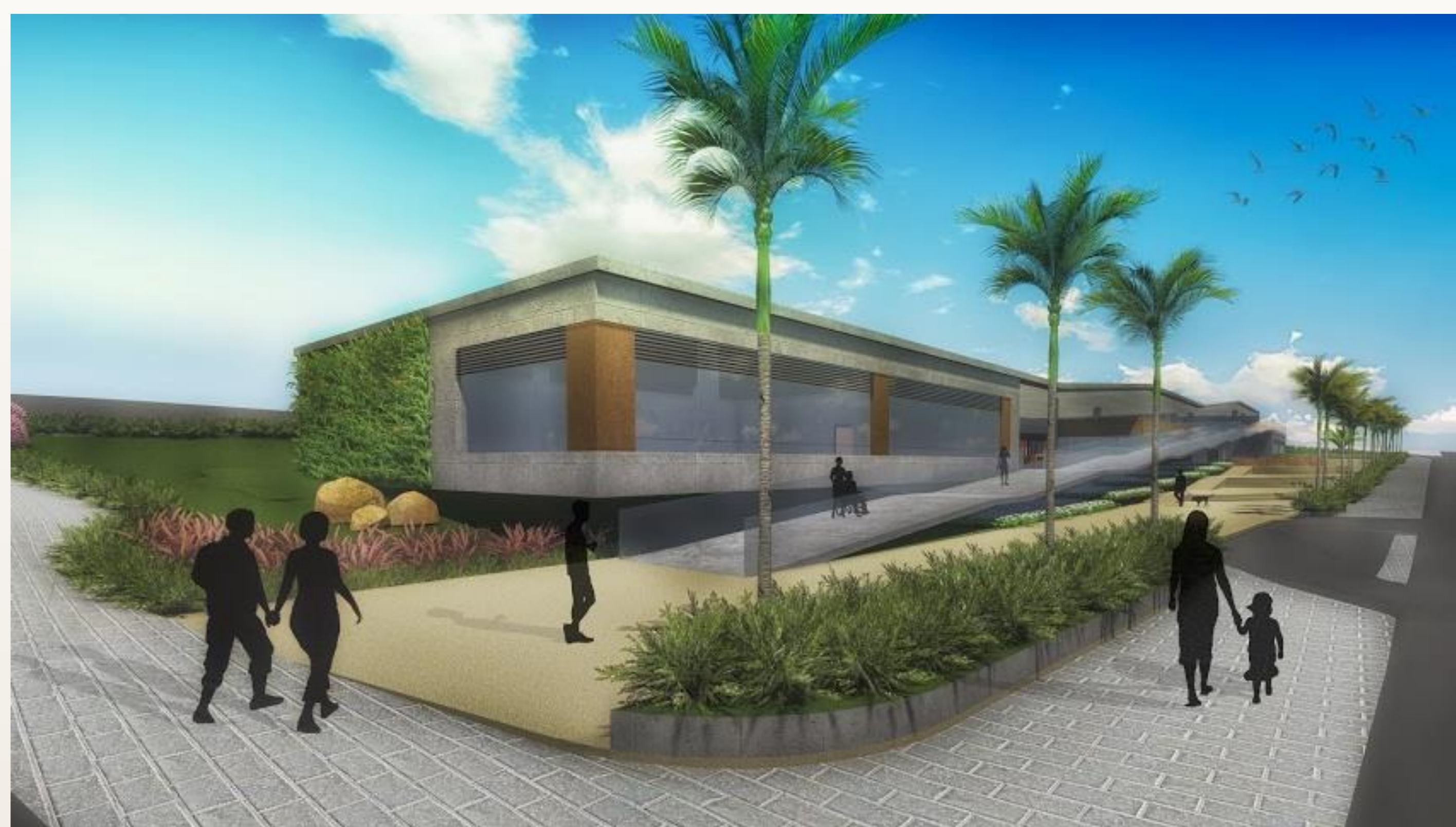
Perspectiva ilustrativa da fachada sudeste