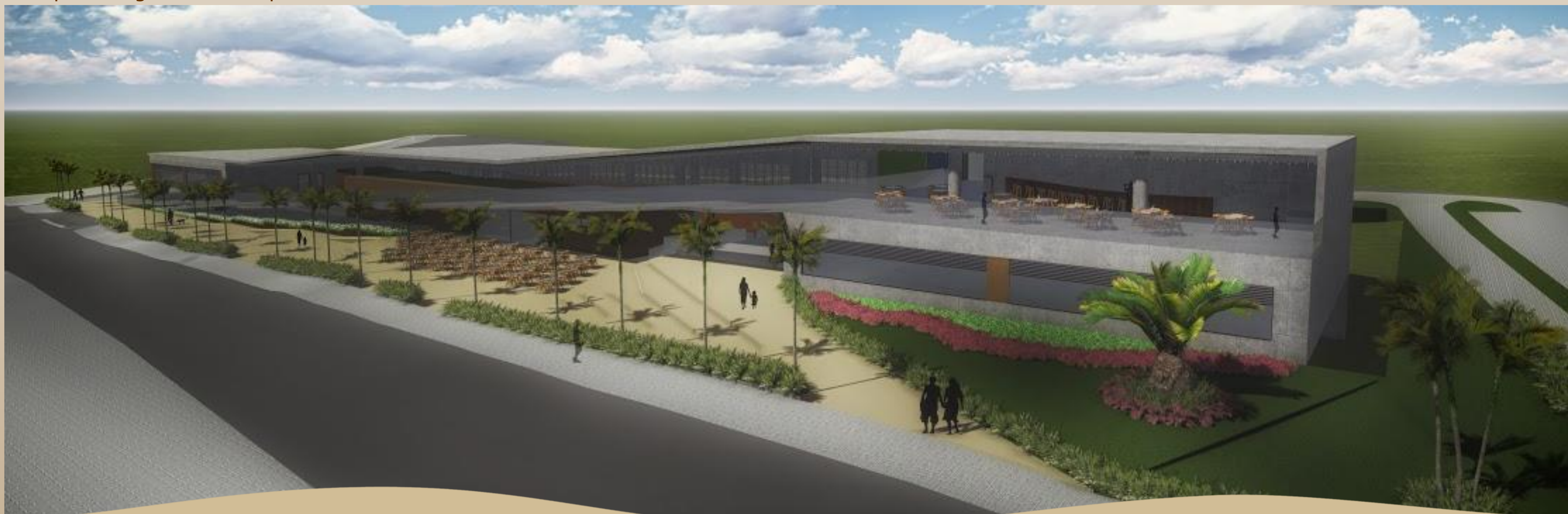
Perspectiva geral do complexo

Como artifícios para minimizar o calor causado pela forte incidência de raios solares na cidade, foi proposto o uso de cobogós na fachada oeste; o sistema de fachada ventilada, que cria uma segunda pele no edifício; fachada verde com jardim vertical; forro acústico com manta termo acústica entre o forro e a laje.