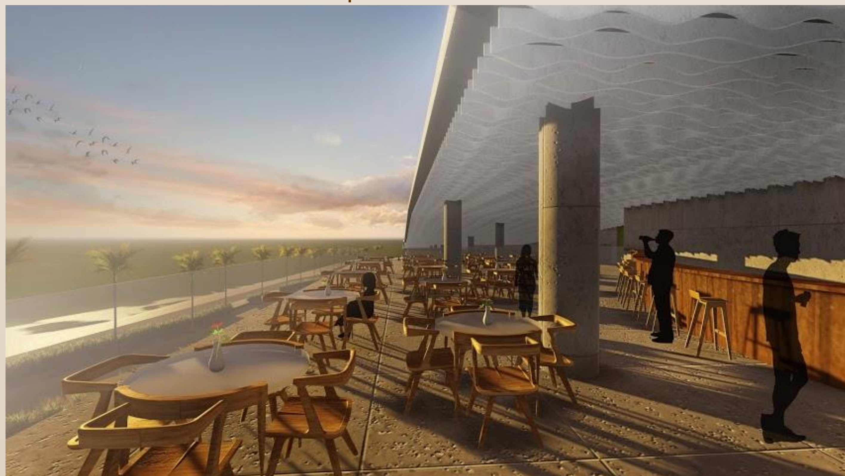
Perspectiva ilustrativa da bar mirante