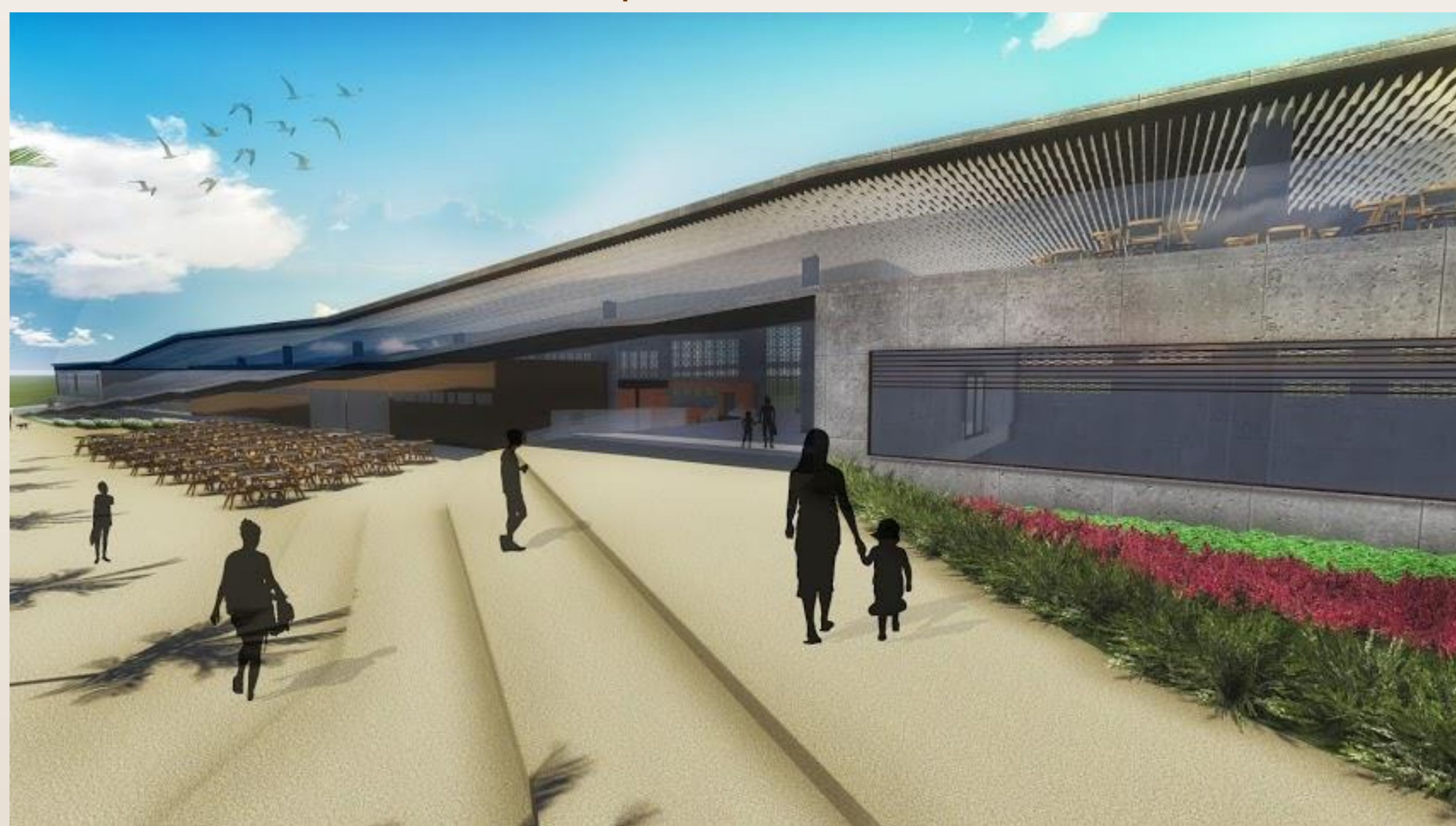
Perspectiva ilustrativa da fachada nordeste