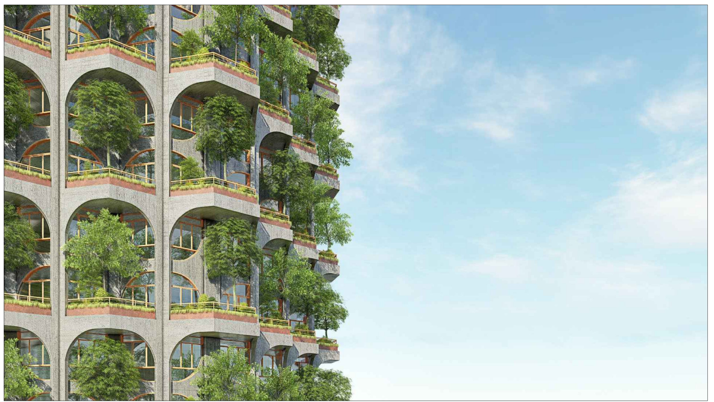
PERSPECTIVA 04 SEM ESCALA