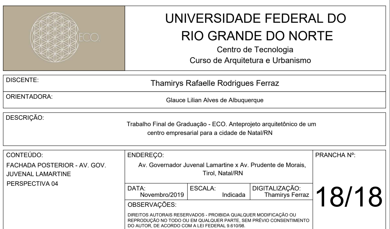
FACHADA POSTERIOR - AV. GOVERNADOR JUVENAL LAMARTINE ESCALA ..... 1/125

OBS.: COM INTUITO DE NÃO ATRAPALHAR A VISUALIZAÇÃO DA ESTRUTURA GERAL, ALGUMAS VEGETAÇÕES NÃO FORAM REPRESENTADAS NESTE DESENHO.