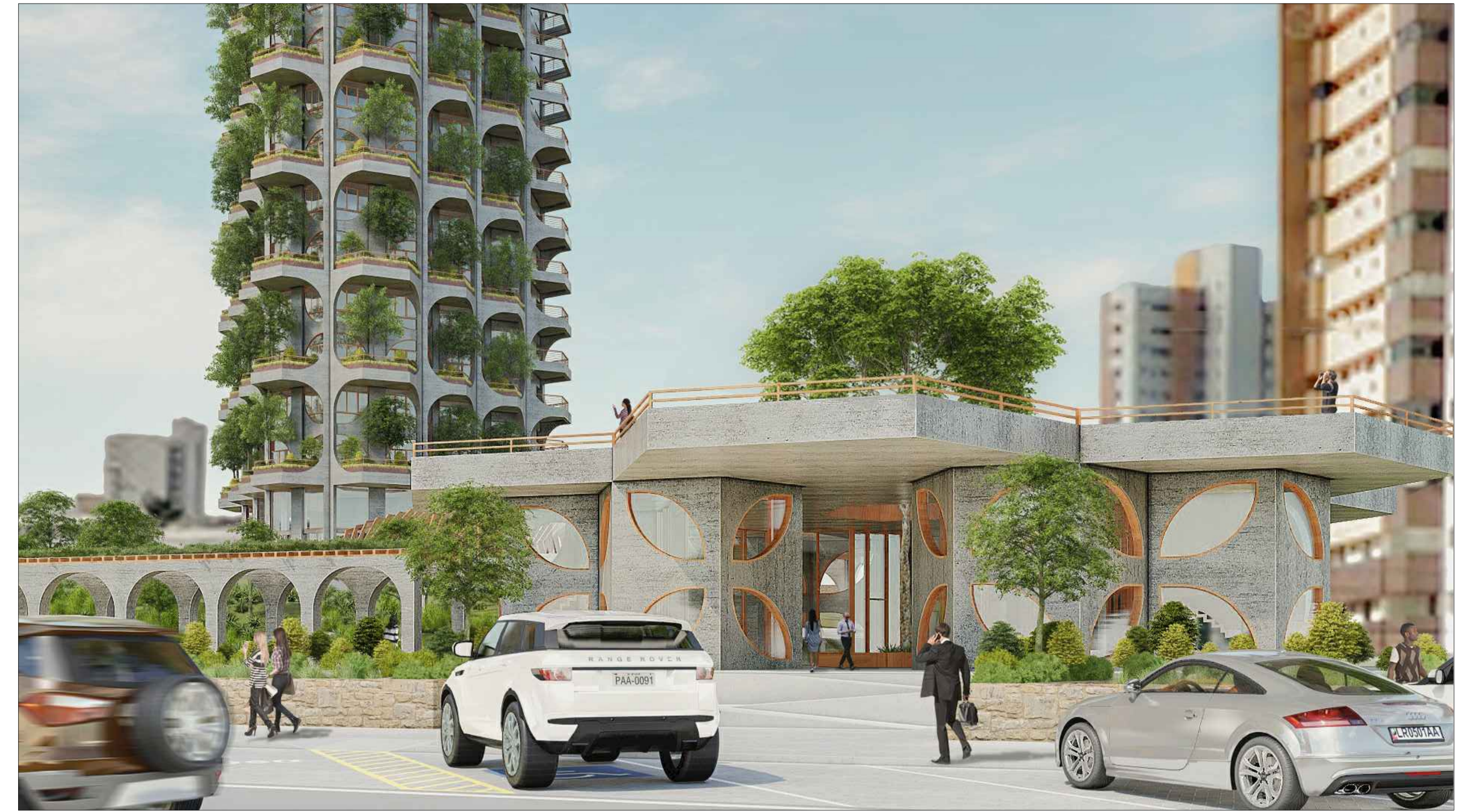
PERSPECTIVA 03 SEM ESCALA