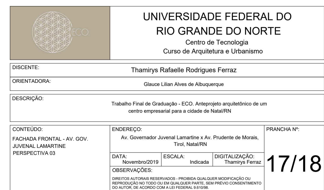
FACHADA FRONTAL - AV. GOVERNADOR JUVENAL LAMARTINE ESCALA ..... 1/125

OBS.: COM INTUITO DE NÃO ATRAPALHAR A VISUALIZAÇÃO DA ESTRUTURA GERAL, ALGUMAS VEGETAÇÕES NÃO FORAM REPRESENTADAS NESTE DESENHO.