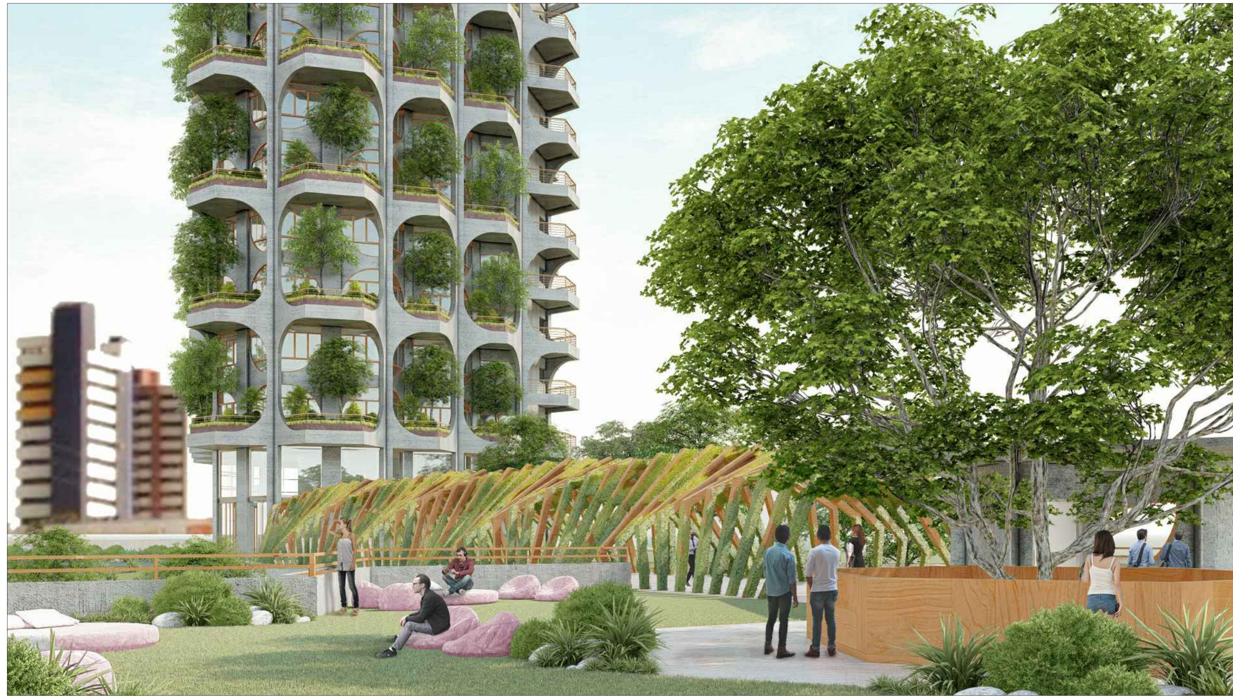
PERSPECTIVA 02 SEM ESCALA